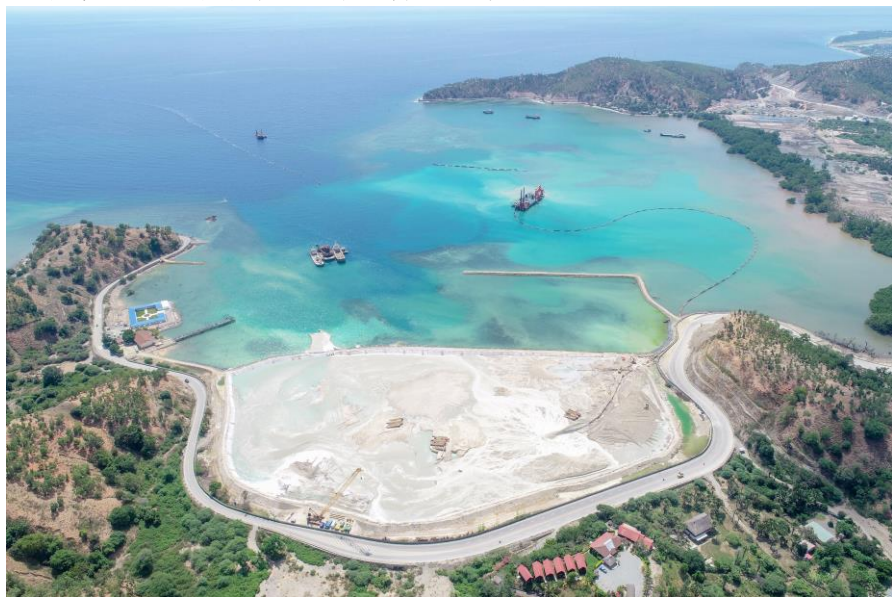
中国港湾公司承建的东帝汶蒂坝港项目

2018年8月30日，蒂坝港正式开工建设，中交集团下属子公司中国港湾工程有限公司承建，该港口规划有630m码头岸线，码头前沿水深设计达-14m，可靠泊10万吨级货船，后方堆场达27公顷，以吹填造地的方式形成，将使港口吞吐能力大为增加。蒂坝港设计能力为60万TEU/年，并预留空间，可将吞吐能力扩建至100万TEU/年。港口预计将于2021年建成，届时帝力港的货运功能将整体迁移，受益于港口吞吐能力、作业效率的大幅增加，海运成本将大幅下降约40%，与地区及全球的互通互通能力将大为增加，有力助推东帝汶国家经济的可持续发展。