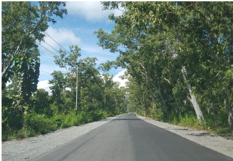
马纳图托-拉克鲁巴道路改造及维护项目

签大型承包工程项目包括中国土木工程集团有限公司承建东帝汶比亚佐液化天然气厂港口设施项目；中国武夷实业股份有限公司承建东帝汶劳拉雷至索利雷马项目等。主要工程承包项目包括上海建工集团股份有限公司承包东帝汶警察局大楼；中铁国际集团有限公司承包东帝汶包考-维可公路项目；上海建工集团股份有限公司承包东帝汶小型道路项目等。东帝汶工程项目大都采用欧美标准。项目设计方案并非由中国企业制作，因此中国标准较难被采用，也没有来自中国的项目监理。